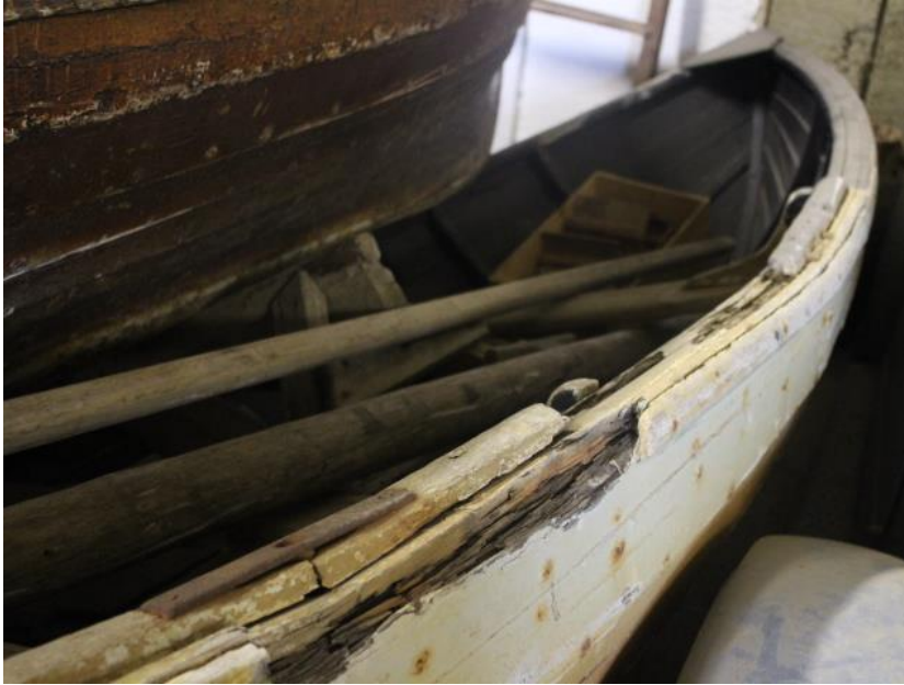
Selabátur frá Eyrarbakka, 2017.