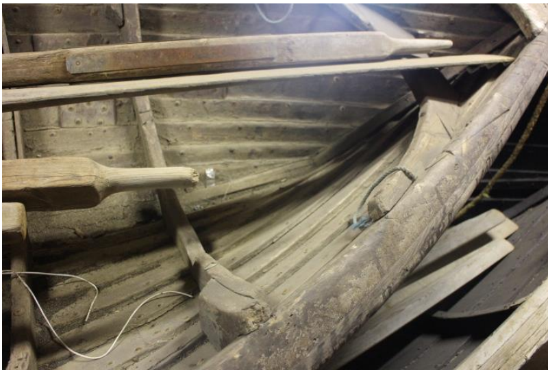
Horft ofan í barka skjögtarans, 2017.