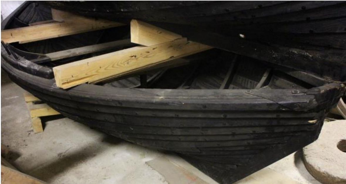
Selabátur frá Fljótshólum, 2017.