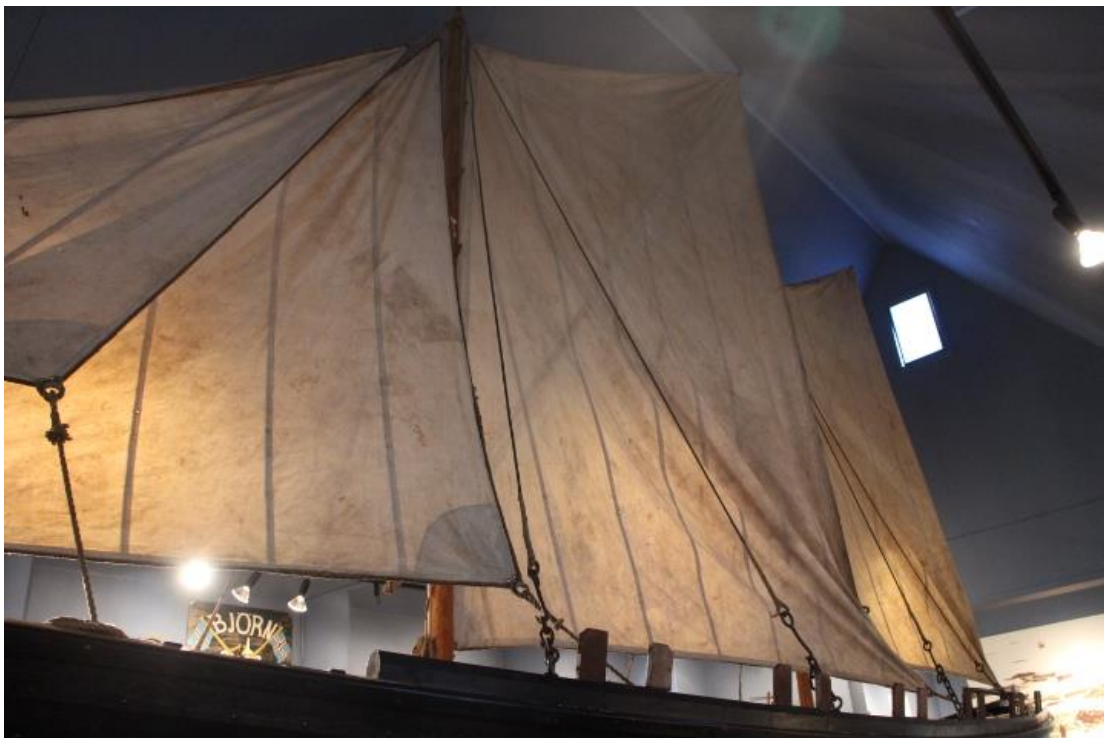
Farsæll er með fjögur segl, sem sennilega voru saumuð um 1962, þegar hann var standsettur þá.