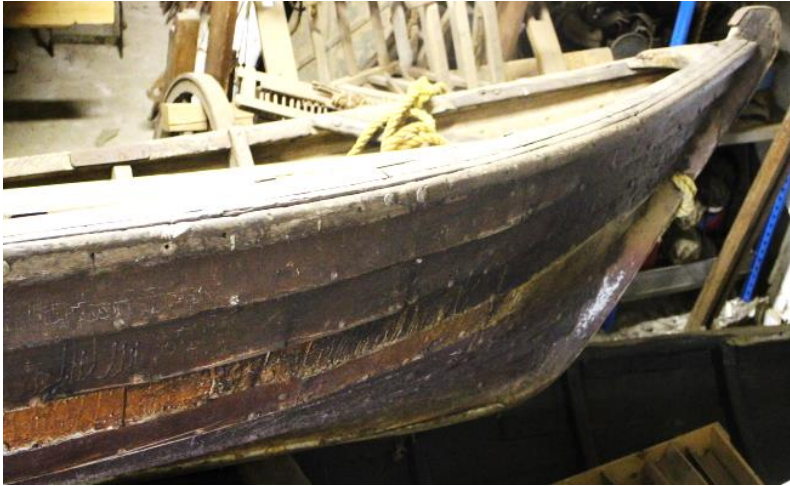
Framhluti skjöttarans frá Eyrarbakka, 2017.