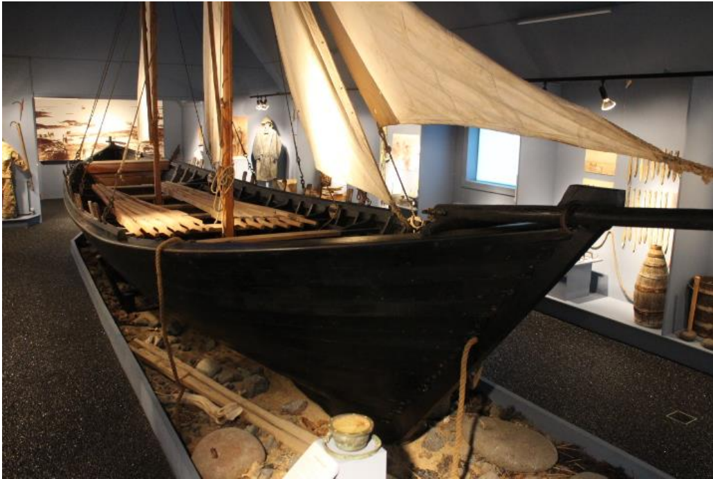
Farsæll á sýningu Sjóminjasafnsins á Eyrarbakka, 2017.