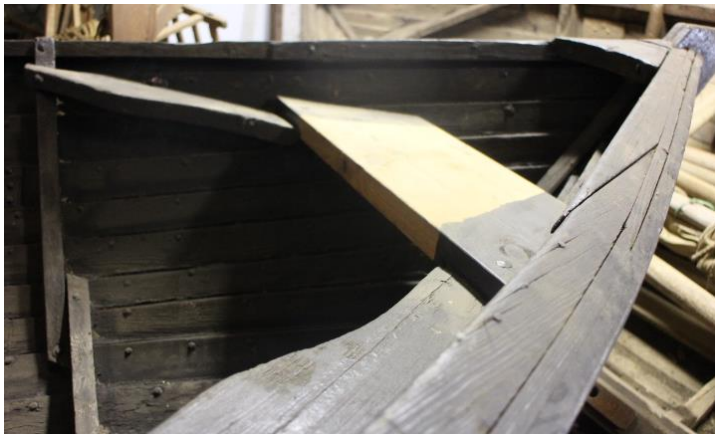
Framstefni selabáts frá Fljótshólum, 2017.

Kemur frá Fljótshólum 1, Flóa, Árnessýslu. Bærinn er við ósa Þjórsár. Var notaður til selveiða við suðurströndina og í Þjórsá fram til 1960.