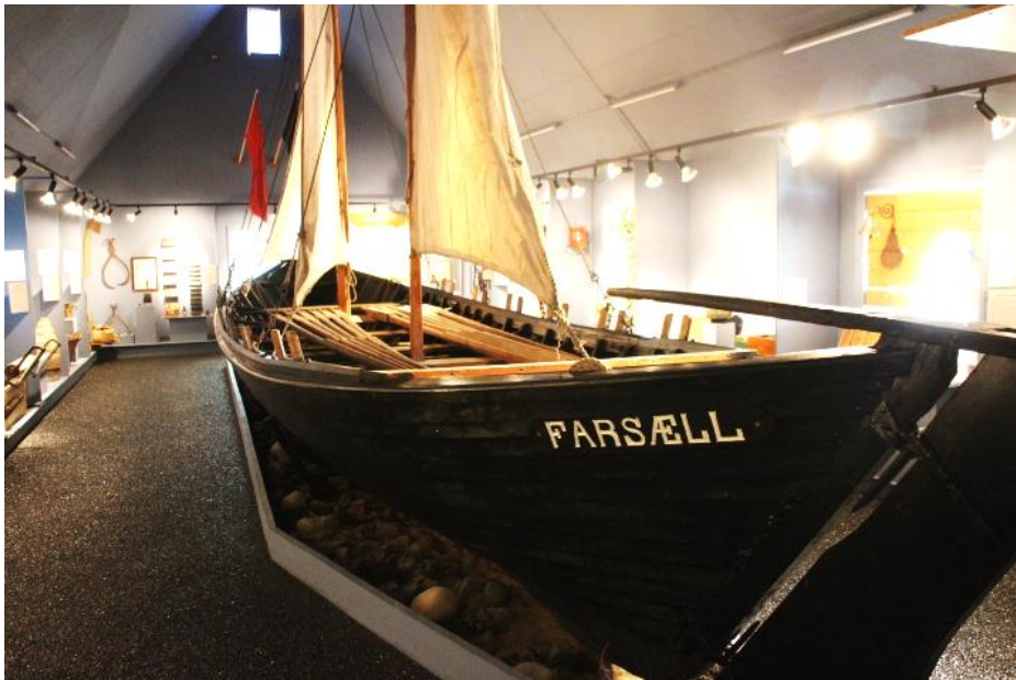
Skutur Farsæls. Ljós. HMS 2017.