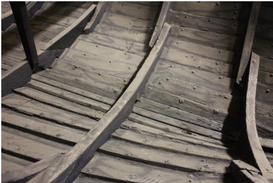
Botn selabáts frá Fljótshólum, 2017.