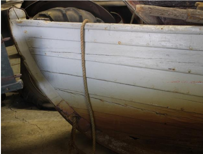
Selabátur frá Eyrarbakka, 2017.