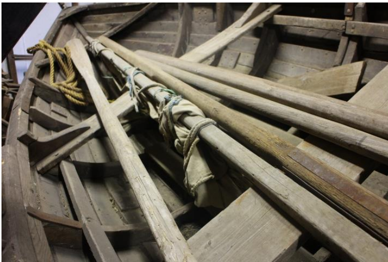
Skjöttarinn með siglu, segli og árum af ýmsum bátum, 2017.