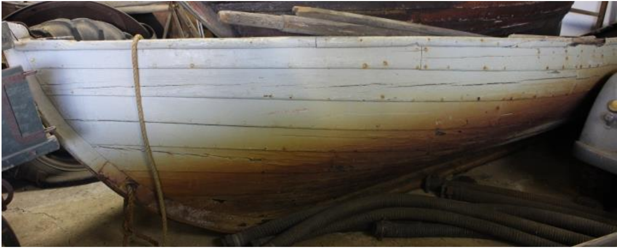
Selabátur frá Eyrarbakka, 2017.