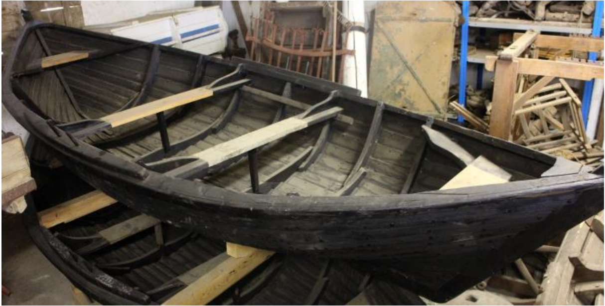
Ferja frá Þjórsárholti, 2017.