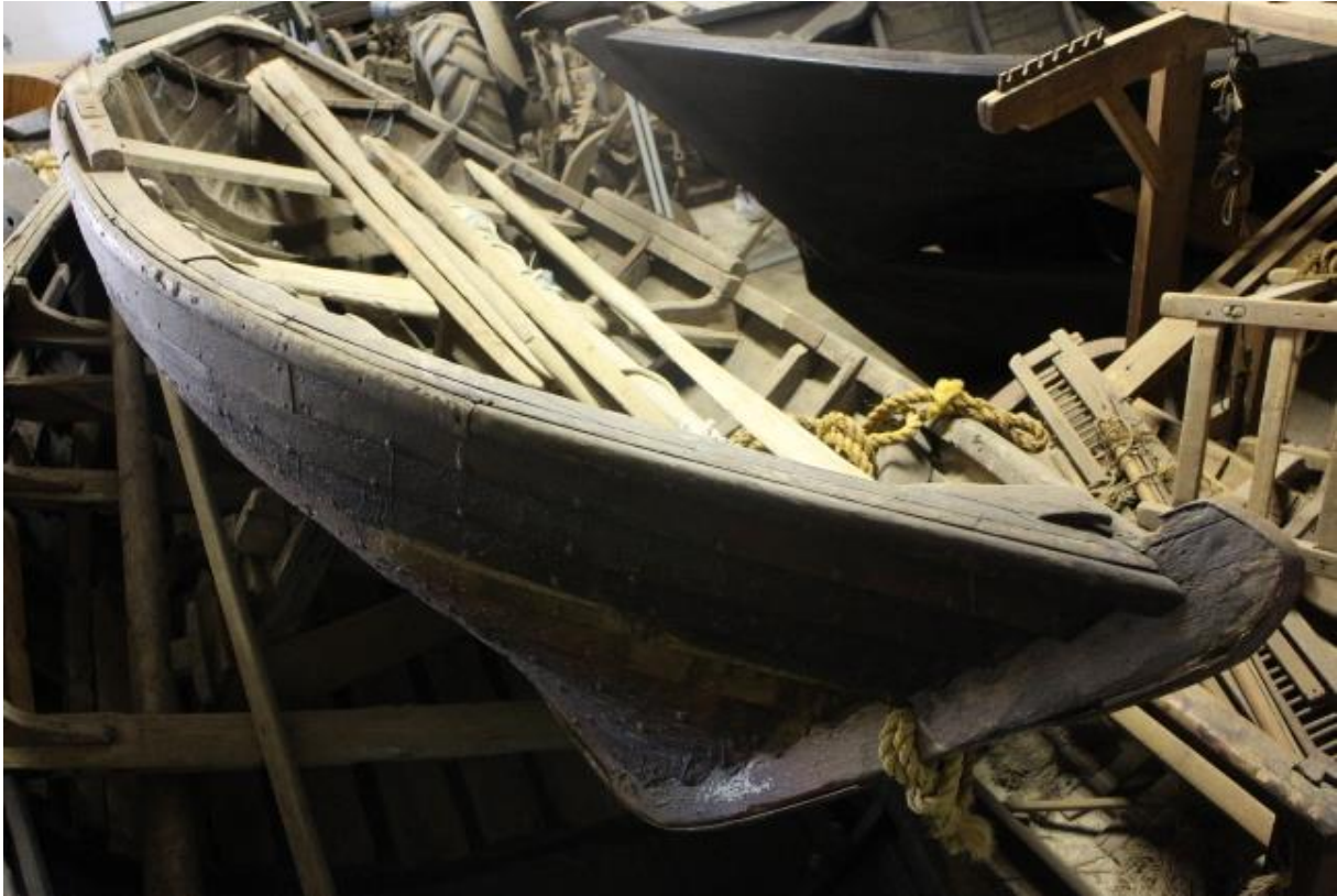
Skjöttari frá Eyrarbakka, 2017.