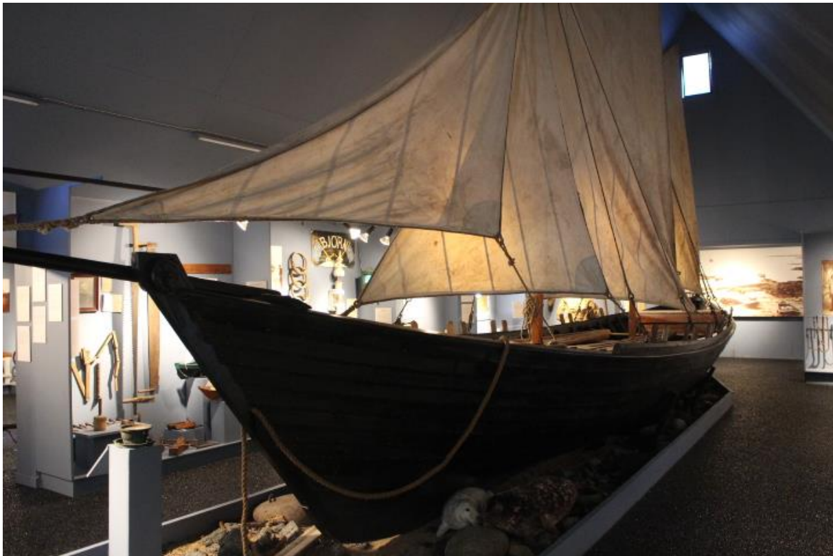
Farsæll á sýningu Sjóminjasafnsins á Eyrarbakka, 2017.