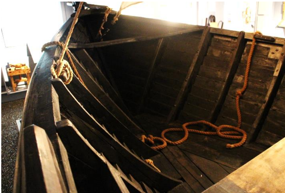
Barki Farsæls.

Farsæll var jafnframt síðasta áraskipið sem gert var út frá Þorlákshöfn. Báturinn er einnig meðal örfárra sem varðveist hafa á landinu og eru stærri en sex- eða áttæringar. Vegna stærðarinnar var hann kallaður áraskip.