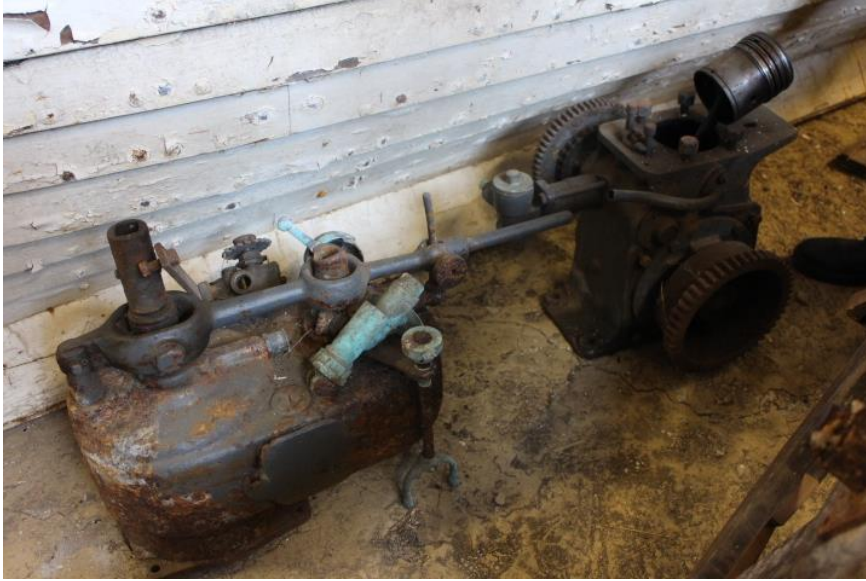
Vélin úr bátnum frá Gamla-Hrauni, 2017.