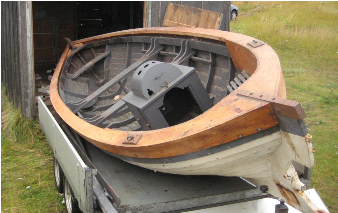
Vélbátur frá Gamla-Hrauni.