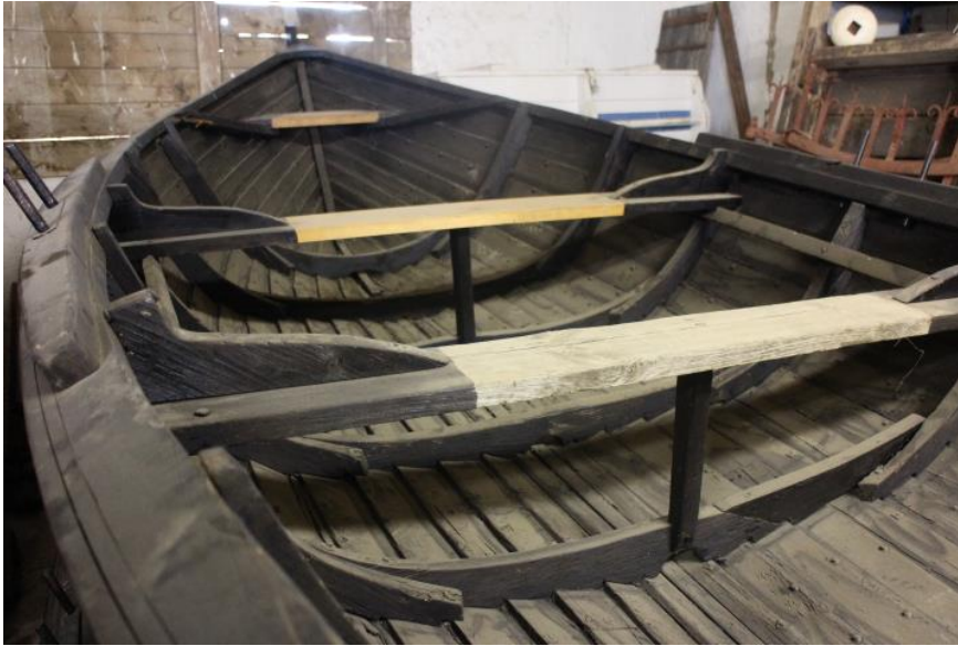
Ferjubátur frá Þjórsárholti, 2017.